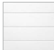
Panel con Rayas Delgada