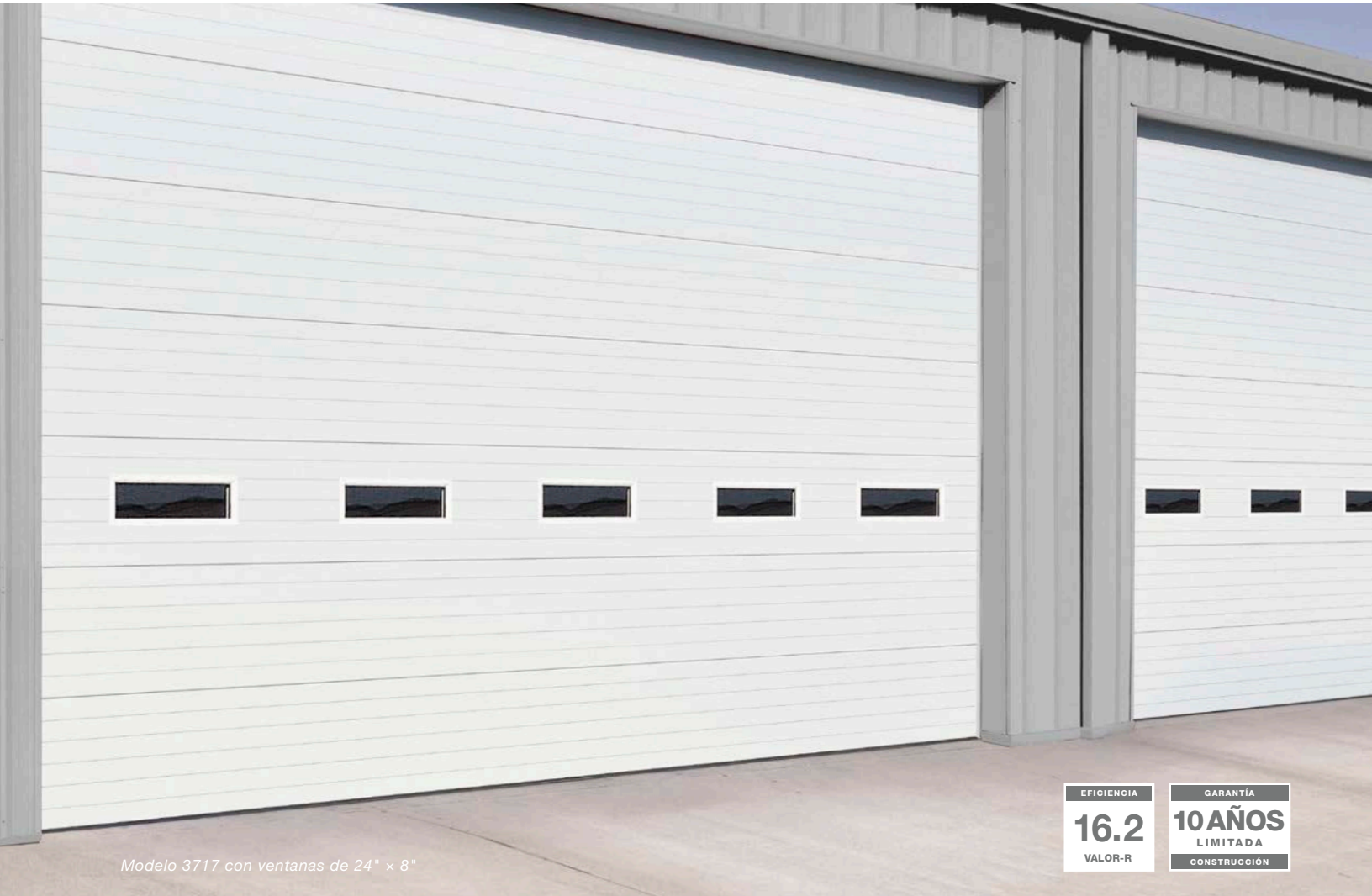
Modelo 3717 con ventanas de 24" x 8"

puertas con aislamiento de poliuretano para aplicaciones de uso intenso