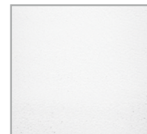
3718 Panel Liso