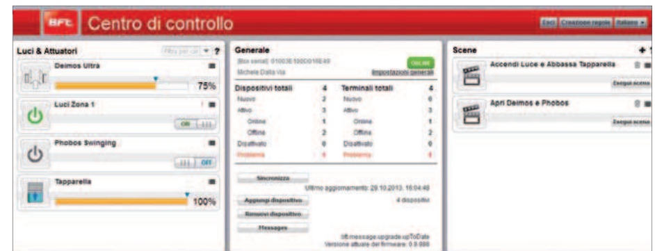
pantalla de la aplicación Magistro